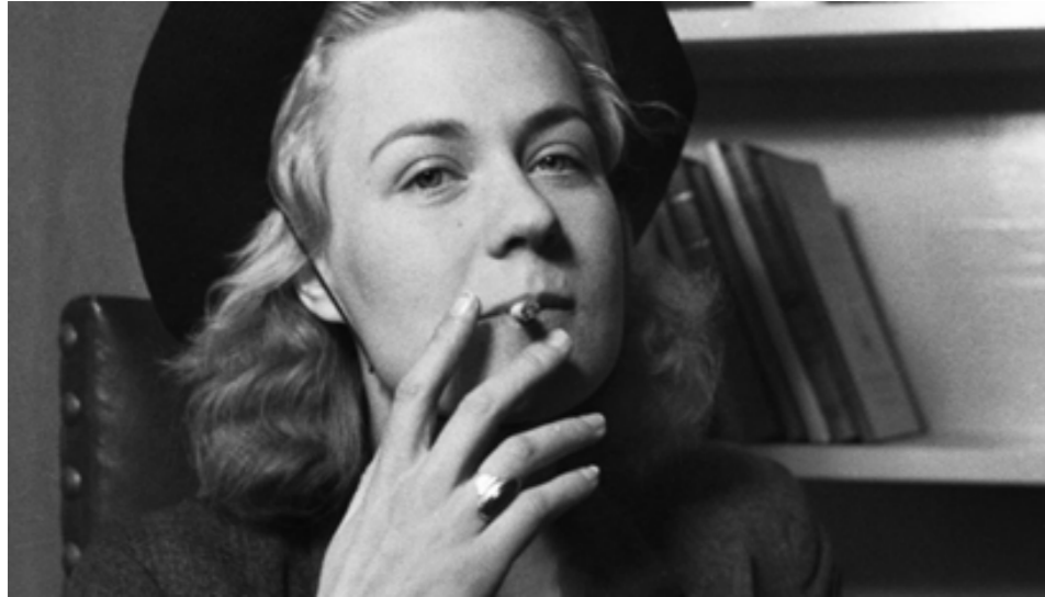
Tove Ditlevsen 1917-1976 (58 år)

Nu er han gået, og mit sind er tømt for gamle klager og forslidte ord- det hele er kun noget vi har drømt, og der gror ingen tanker i dets spor.