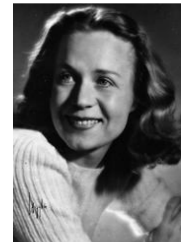
Tove Ditlevsen, Tove Irma Margit Ditlevsen, 14.12.1917-7.3.1976, dansk forfatter. Tove Ditlevsen betragtede sig fortrinsvis som lyriker og var dybt forankret i den danske lyriktradition. Billedet er fra hendes udgivelse i 1939, “Pigesind”

Digtet rummer kun få metaforer, og slutter af med en sammenligning. I første strofe møder vi “gamle klager” og “forslidte ord” = de beklagelser og uenigheder parret har haft i tidens løb, som er blevet brugt gentagende gange. I anden strofe findes verset “luvslidt er vanens lille grå tyran” her er slidte vaner fået personlige egenskaber som en “grå tyran” (Personifikation) Den “grå” farve symboliserer noget dystert og trist. Tredje strofe byder på skænderier, der er så følsomme at de beskrives som “blottet som en nerve i en tand”. I fjerde strofe er det abstrakte ord “nederlag” blevet tilegnet evnen til at blive gemt ned og forsegle = “et nederlag er fuldbragt og forseget og gemt ned”. Tredje vers i denne strofe er stjerner besjælet med evnen til at synke = “-og alle stjerner synker” og “en dag” som rummer personifikation,